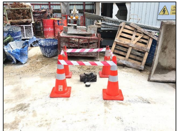
บริเวณพื้นที่โครงการ (พิกัด : 13°44'33.0" N, 100°32'44.1" E)