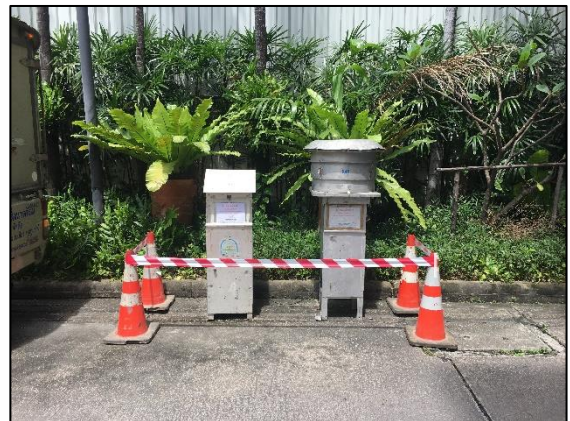
ภายในโรงแรมบลิสตัน สุวรรณ พาร์ควิว (พิกัด : 13°44'32.2" N, 100°32'43.9" E)

ตรวจวัด Total Suspended Particulate (TSP) และ Particulate Matter (PM 10 )