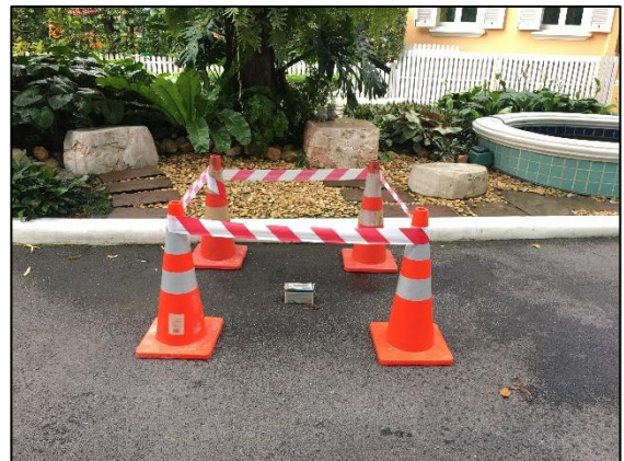
บริเวณพื้นที่โรงเรียนอนุบาลนานาชาติมัลเบอร์รี่เฮาส์ (พิกัด : 13°44'33.4" N, 100°32'44.1" E)