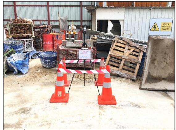
บริเวณพื้นที่โครงการ (พิกัด : 13°44'31.6" N, 100°32'44.2" E)