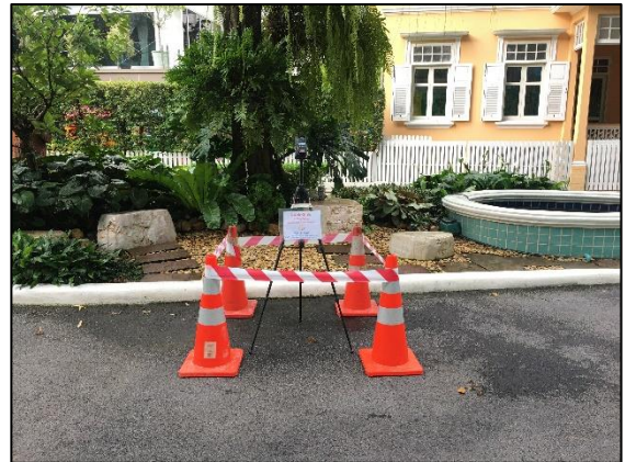
บริเวณพื้นที่โรงเรียนอนุบาลนานาชาติมัลเบอร์รี่เฮาส์ (พิกัด : 13°44'33.7" N, 100°32'43.9" E)

รูปที่ 3-2 (ต่อ) แสดงการตรวจวัดระดับเสียงโดยทั่วไปและระดับเสียงรบกวน โครงการ Tonson One Residence (ต้นสน วัน เรสซิเดนซ์) (ระยะก่อสร้าง) เดือนกรกฎาคม-ธันวาคม 2565