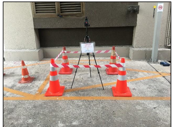
ภายในโรงแรมบลิสตัน สุวรรณ พาร์ควิว (พิกัด : 13°44'31.9" N, 100°32'44.0" E)

รูปที่ 3-2 (ต่อ) แสดงการตรวจวัดระดับเสียงโดยทั่วไปและระดับเสียงรบกวน โครงการ Tonson One Residence (ต้นสน วัน เรสซิเดนซ์) (ระยะก่อสร้าง) เดือนกรกฎาคม-ธันวาคม 2565