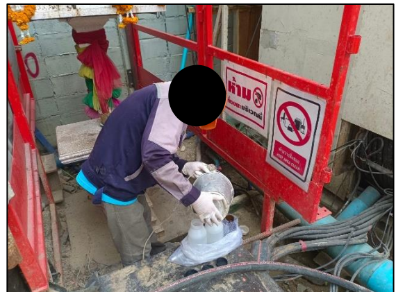
ระบบบำบัดน้ำเสียสำเร็จรูป